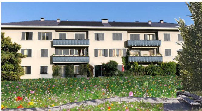
Immeuble du 7-9 Hutins rénové entouré d'un espace vert renaturé. (Image de synthèse après rénovation)

Cela fait un plus d'une année que le projet nécessitant la démolition de l'immeuble 7-9 chemin des Hutins a été refusé par plus des 55% des votants et votantes de la commune. Le représentant du groupe Demain Confignon présent au conseil de la Fondation du logement (FL) travaille pour que l'immeuble soit rénové et qu'un accord soit trouvé avec les représentants