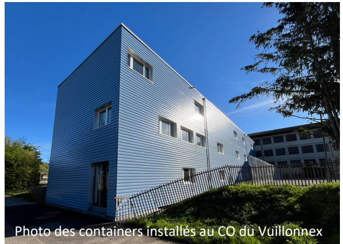
Photo des containers installés au CO du Vuillonex

Mais la question des écoles va au-delà du nombre de classes. Il faut prévoir des accès sécurisés que les enfants puissent parcourir en toute sécurité et à pied. Nous constatons la véritable césure qu'est la route de Chancy pour les enfants devant la traverser au quotidien. La route de Base restera aussi un obstacle. Si les enfants doivent se déplacer pour aller au cycle, alors il faut une voie verte en site propre.